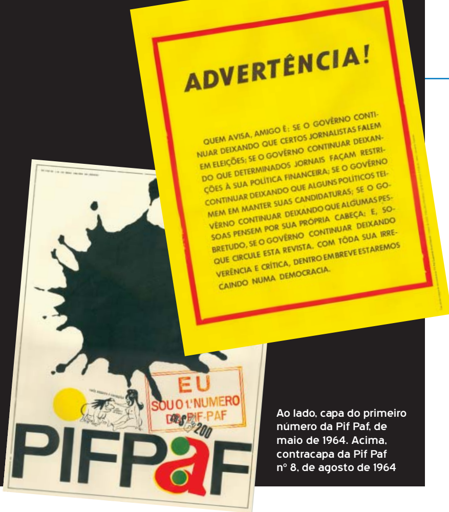
Ao lado, capa do primeiro número da Pif Paf, de maio de 1964. Acima, contracapa da Pif Paf nº 8, de agosto de 1964